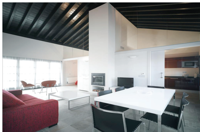
Stora rymliga villor fullt utrustade med moderna kök